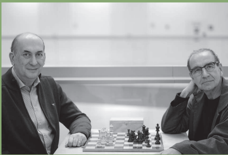
Die Autoren beim Schachspiel